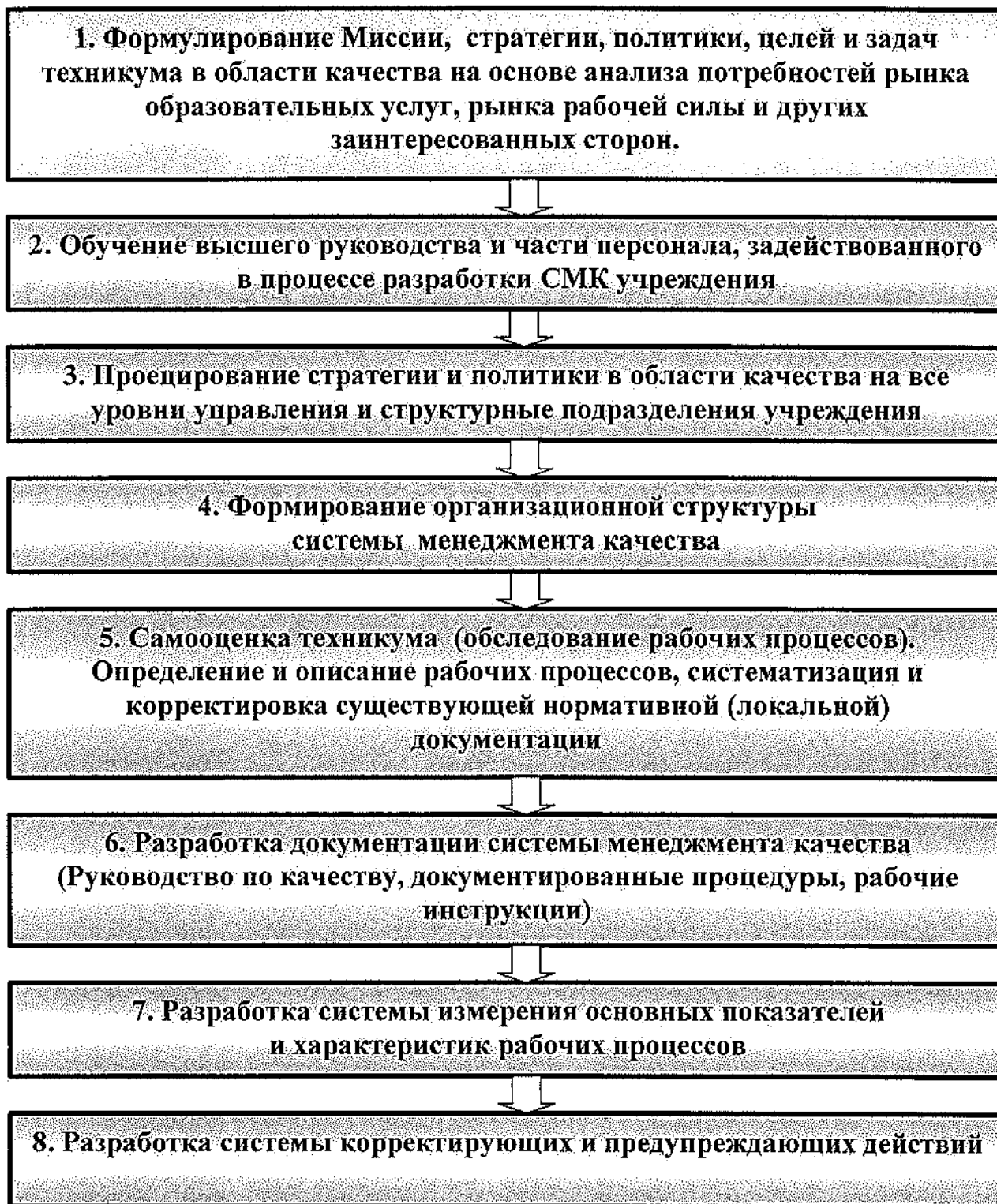
Рисунок 1 - Этапы построения SMK учреждения